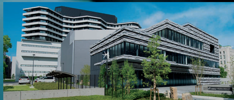
大阪重粒子線センター(手前) / 大阪国際がんセンター(奥)